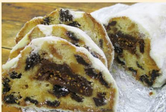
シュトーレン 小 ¥1,836(税込) カット ¥324(税込)

イーストを使用したパン生地にドライフルーツ、ナッツをふんだんに加えて焼き上げました。時間がたつほど独特の香り奥深い豊かな味わいが生まれます。