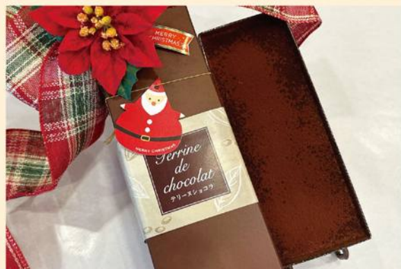
テリヌショコラ ¥1,944(税込)

国産チョコレートを2種類使い、バター、生クリームを使用して焼きあげました。ほのかにオレンジの香りを加えました。極上の口溶けと濃厚な味わい。